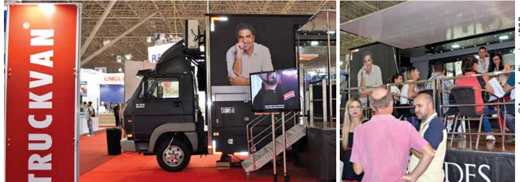
(1) Truckvan expôs a Cozinha Estúdio Móvel. (2) Food Truck foi apresentado no estande da Topema, fornecedora de equipamentos de cozinha