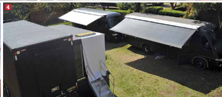
(1) O novo Camarim Móvel da Truckvan tem 10 metros de comprimento. (2) A Unidade Móvel possui duas salas de avanço sem pés de apoio. (3) O veículo tem uma área útil de, aproximadamente, 40 m 2 . (4) A Truckvan disponibilizou, ao todo, cinco unidades móveis para a estrutura de backstage do Festival CCSP