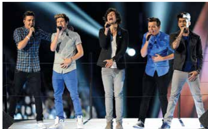
Banda ficou famosa ao participar do programa de talentos X-Factor , no Reino Unido. Abaixo, a Carreta Camarim, com 15 metros de comprimento, estacionou no estádio do Morumbi às 17h do dia 9 de maio, véspera do primeiro show